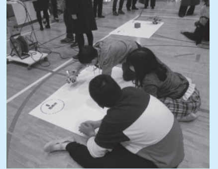
成増ヶ丘小学校の授業の様子

2年前までは、プログラミング教育は、いわば「未開の地」でした。2校の推進校の先生方も、どのように授業をしたらよいか試行錯誤しながら研究を進め、現在では、区内はもちろん都内の小学校のお手本となっています。これら2校の取組を基に、各小学校で取り組まれるプログラミング教育に、ぜひご注目ください。