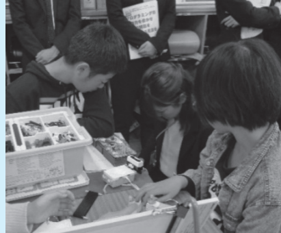
上板橋第四小学校の授業の様子

(※1)目標を達成するために必要な手順や活動を考えたり、うまくいかない時にどこを改善するかなどを論理的に考えたりする力 (※2)問題を解決する手順などを矢印や記号で流れに沿って表す図