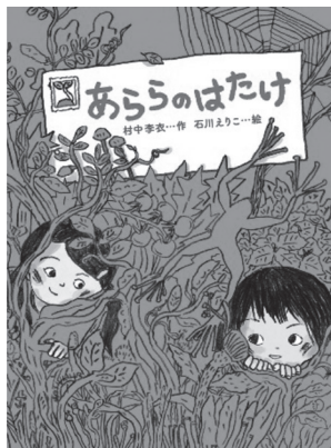
「あらかのはたけ」 村中李衣/作 石川えりこ/絵 偕成社

区立各図書館にリストと一緒に本をそろえています。ぜひご利用ください。また、板橋区立図書館のホームページでもリストを公開しています。