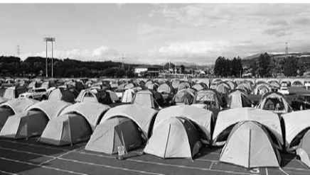
熊本地震の際のテント村の様子

【質問】テントを活用した避難所であるテント村は、感染症対策やプライバシー保護の観点で非常に有効と考える。区における導入の可能性は。