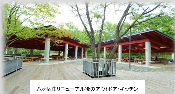
八ヶ岳荘リニューアル後のアウトドア・キッチン