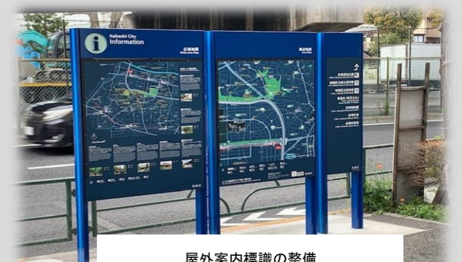
屋外案内標識の整備