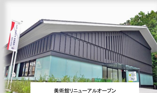
美術館リニューアルオープン