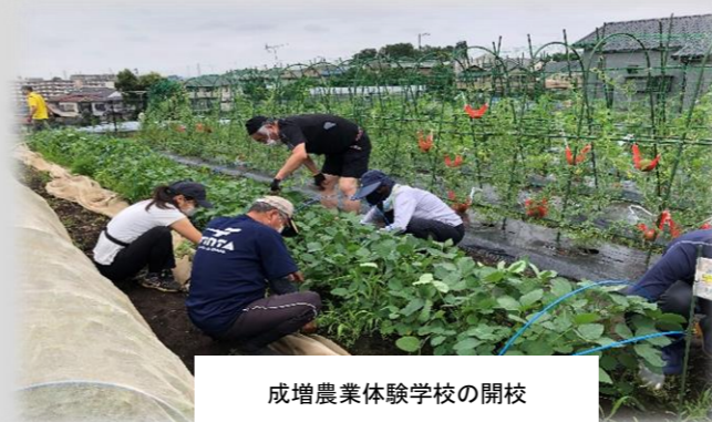
成増農業体験学校の開校