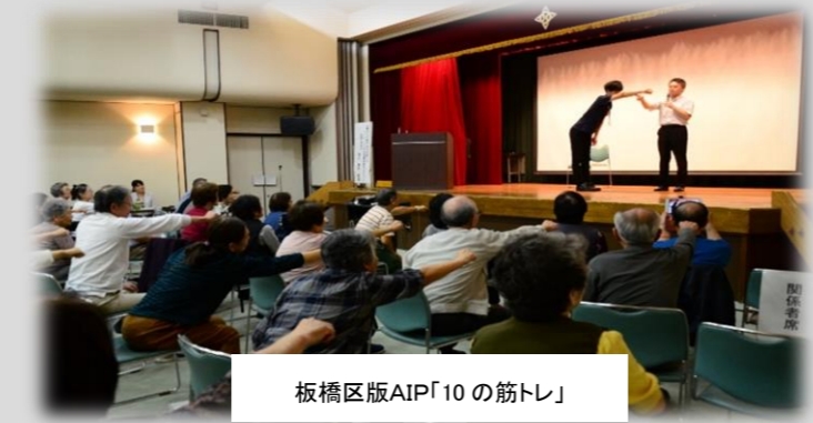
板橋区版AIP「10の筋トレ」