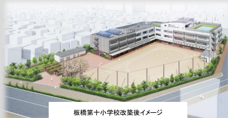
板橋第十小学校改築後イメージ