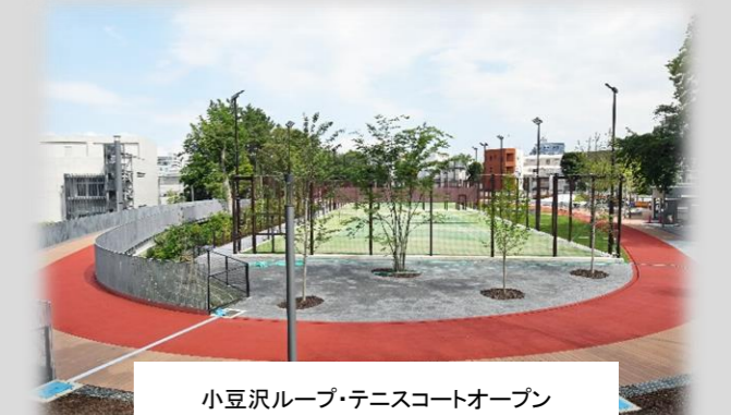
小豆沢ループ・テニスコートオープン