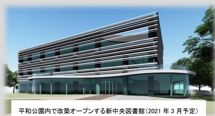
平和公園内で改築オープンする新中央図書館(2021 年 3 月予定)