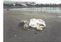
漂着したオイルボール

油を下水道に流すと下水道管で冷えて固まり、つまりや悪臭の原因になります。また、大雨が降ったとき、固まった油は、はがれてオイルボールとなり、川や海に流出し、水環境を汚してしまうことがあります。