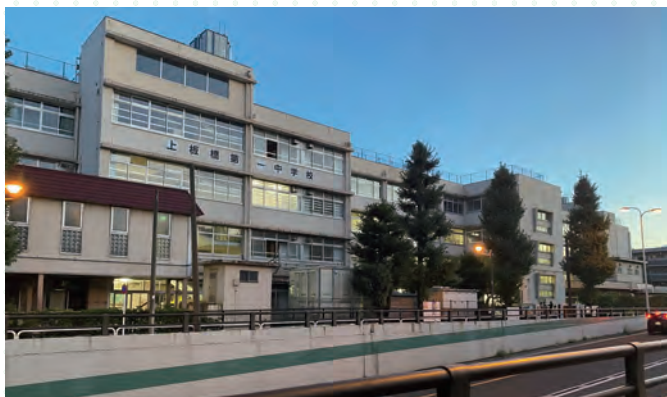
■環状七号線側から見た現校舎

令和2年度には、「改築工事中の仮校舎運営のお知らせ」、「上板橋第一中学校改築アンケート」を実施し、令和3年10月には「上板橋第一中学校改築検討会」が設置されました。