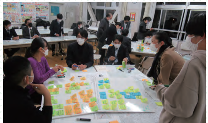
■意見交換では、様々なアイデアを出していただきました。