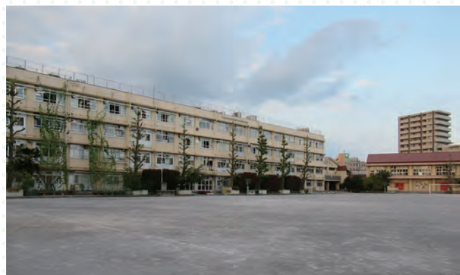
■グラウンドから見た現校舎