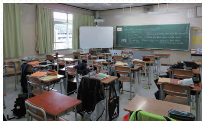
■現校舎の普通教室