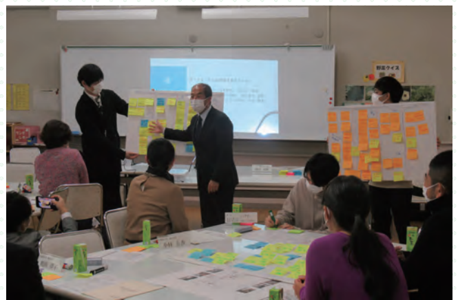
■各グループの意見交換後には発表を行っていただきました。