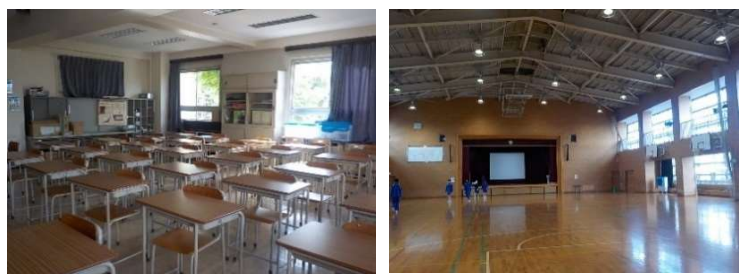
引越し先の上板橋第二中学校の様子

A. 中学校の旧校舎を使用するため、通常時と同じく落ち着いた環境で学校生活を送ることができます。特別支援学級（固定級）についても校舎内に設置され、上板橋第一中学校同様の運営が行われます。