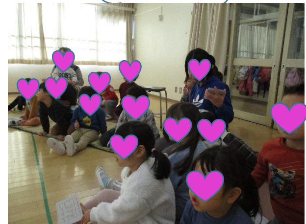
お友達の挑戦の様子を、じっと見守るりんごさん