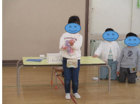
♪もしもし かめよ～ かめさんよ～