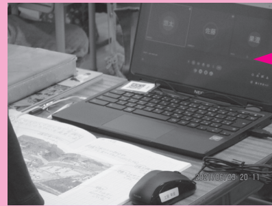
離れた席同士でグループを組んでの話し合い

複数人で話し合いや交流をする際に、テレビ電話のように、離れた場所にいる相手とでも直接顔を見て、声を聞いてコミュニケーションをとることができます。多人数で集まれないときや離れた場所にいる場合でも、話し合いや集会等に活用できるので、学びや活動の選択肢が増えます。