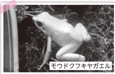
モウドクフキヤガエル