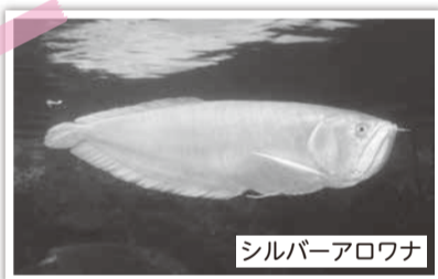
シルバーアロワナ