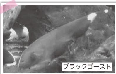
ブラックゴースト