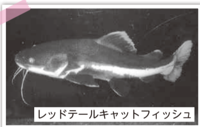
レッドテールキャットフィッシュ