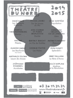
リール・北劇場ポスター、2014-15年