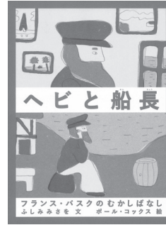
ヘビと船長 (BL出版、2021年)

※2日制、14時~17時。▶ 内容 = 講義・実技 ▶ 対象 = 高校生以上 ▶ 定員 = 20人(申込順) ▶ 費用 = 3000円 ▶ 申込 = 11月13日(土)朝9時から、電話で、区立美術館