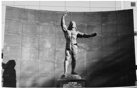
板橋区役所の平和祈念像

【区長】これまでも平和都市宣言記念事業としての取組みを実施し、平和について考える機会を提供している。引き続き、平和事業を推進する。