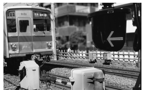
東武東上線の踏切

【教育長】都が実施主体であり、今後も動向を注視する。 ※以上のほか、すべての人の投票権を保障するために、財政運営について質問があった