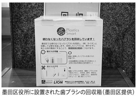
墨田区役所に設置された歯ブラシの回収箱