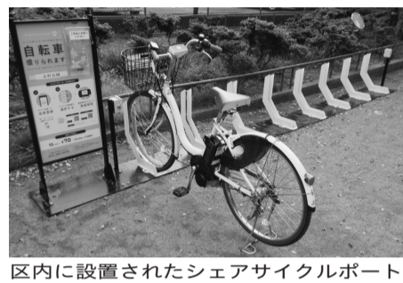
区内に設置されたシェアサイクルポート

【質 問】駅前の駐輪場のうち、利用者が減少傾向にある駐輪場に、シェアサイクルポートのラックを増設すべき。