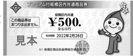
プレミアム付板橋区内共通商品券

【質 問】経済対策・消費喚起策として飲食店クーポンの配布や助成事業を拡充すべき。