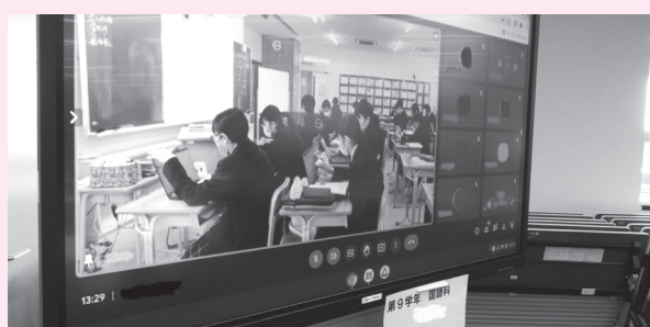
授業のオンライン配信の様子

令和4年度より、引き続き全ての区立学校において、「読み解く力」の育成を学力向上の要として、小中一貫教育のさらなる推進を図っていきます。