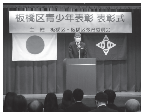
「表彰式の様子」※撮影時のみマスクをはずしております。