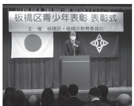
「表彰式の様子」※撮影時のみマスクをはずしております。