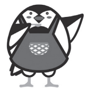
板橋区食育キャラクター「いたばちい」

板橋区の学校給食は今年で75周年を迎えます。これを記念して、板橋区の学校給食に関する展示や動画の放映を区役所1階のイベントスクエア・プロモーションコーナーで開催します。皆様のご来場をお待ちしています。