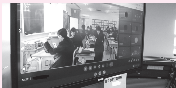
授業のオンライン配信の様子

令和4年度より、引き続き全ての区立学校において、「読み解く力」の育成を学力向上の要として、小中一貫教育のさらなる推進を図っていきます。