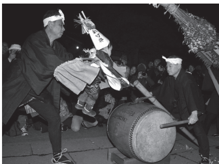
赤塚諏訪神社田遊び「駒」 子どもをのせた「駒」が「花籠」に突進し、悪を祓う