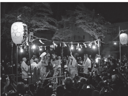
徳丸北野神社田遊び「田植え」 稲の苗に見立てた子どもを太鼓の上のせ、苗と子どもの成長を願う

赤塚の田遊びも、徳丸北野神社と同じく一年間の稲作の様子が演じられます。所作や笛の演奏なども口伝によって現在まで1000年以上にわたって受け継がれています。