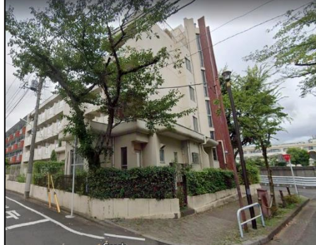
旧職員住宅高島寮跡地