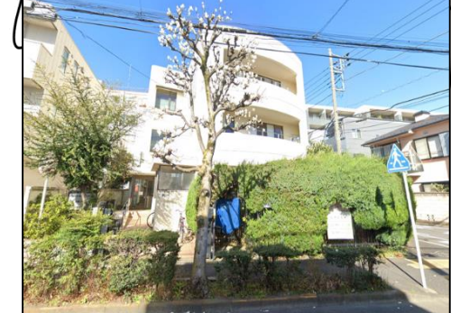
東新しいこいの家