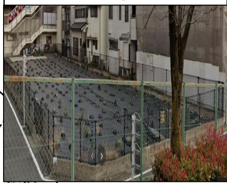
旧職員住宅高島寮跡地