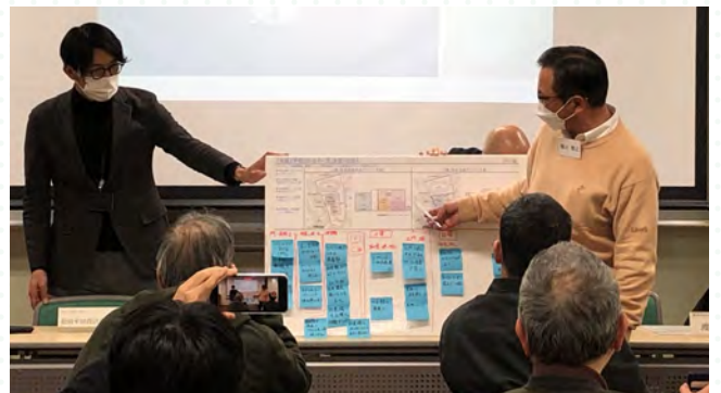
■各グループの意見交換後には発表を行いました。