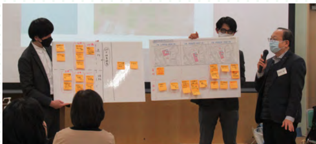
■各グループの意見交換後には発表を行いました。