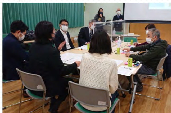
■意見交換では、様々なアイデアを出していただきました。