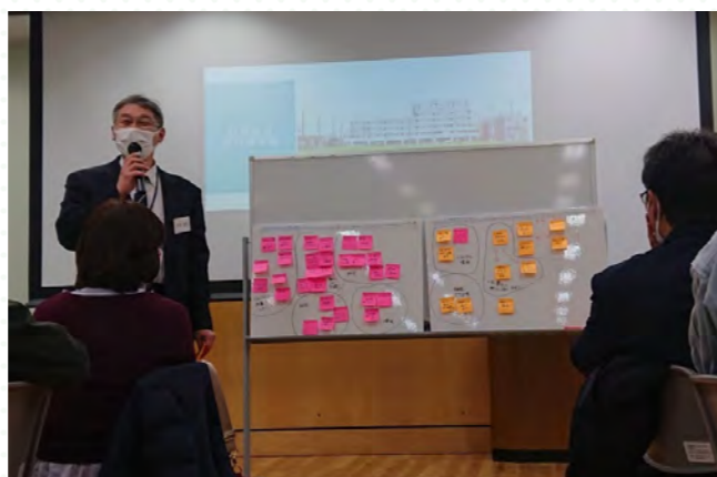
■各グループの意見交換後には発表を行っていただきました。