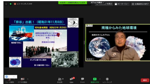
■板橋エコみらい塾（オンライン講演会）