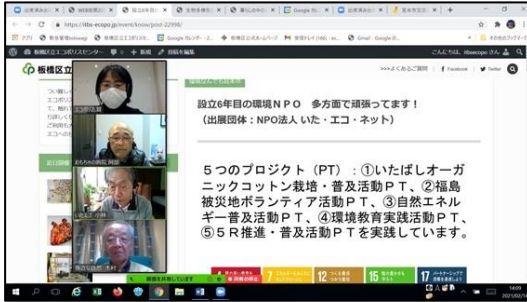
■環境なんでも見本市（オンライン交流会）

環境への「興味・関心」を深め、「参加・体験」していただく機会として、様々な環境関連のイベントを開催しています。環境保全活動の実践につなげるため、「環境なんでも見本市」などのイベントを実施し、意識啓発を行っています。