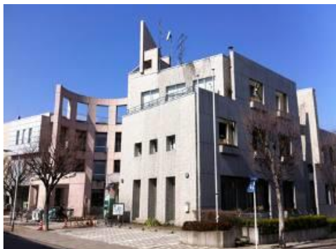
■ エコポリスセンター

今後も地域と密着した環境教育の拠点施設として、区民や事業者、団体などと連携を図り、良好なパートナーシップを築いていくための活動に取り組んでいきます。