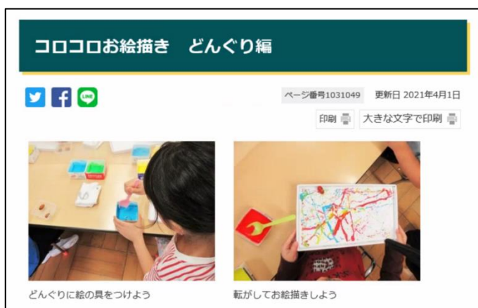
■プログラムの例：ココロお絵描き どんぐり編 (絵の具をつけたどんぐりを画用紙の上で転がしお絵描きをするプログラム：未就学児対象)