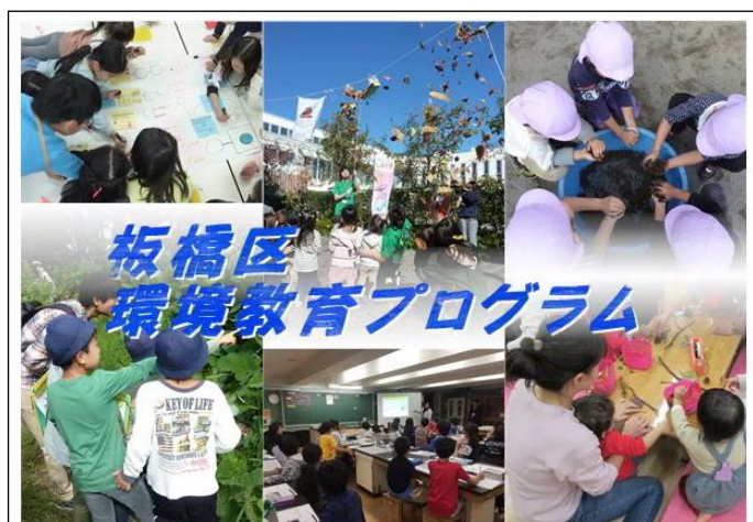
■環境教育プログラム（ホームページ画面）

https://www.city.itabashi.tokyo.jp/bousai/kankyo/kyoiku/1015347/index.html