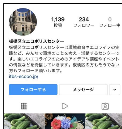
■エコポリスセンター インスタグラム