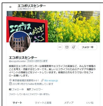
■エコポリスセンター ツイッター

※ エコポリスセンターの公式ホームページ、ツイッター、フェイスブック・インスタグラムの情報を更新した回数の合計を集計したもの。