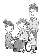
表2 認知症の方を介護する家族のための交流会

▶とき・ところなど(各1日制)=表2参照 ▶内容=交流・情報交換▶対象=認知症の方を介護している家族※定員など詳しくは、お問い合わせください。▶申込・問=電話で、おとしより保健福祉センター認知症施策推進係 ☎5970-1121