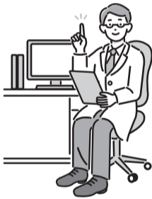
表1 医師によるもの忘れ相談

参照▶対象=区内在住の65歳以上で、もの忘れで医療機関にかかっていない方※家族(区外在住を含む)も相談可▶定員=各回1人(申込順)▶申込・問=電話で、希望するおとしより相談センター