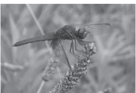
ショウジョウトンボ