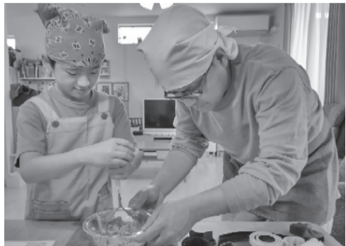
親子で料理してみませんか