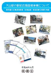
駅前広場パンフレット