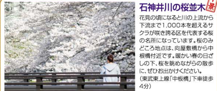
石神井川の桜並木 花見の頃になると川の上流から下流まで1,000本を超えるサクラが咲き誇る区を代表する桜の名所になっています。桜のまどろこ地点は、向屋敷橋から中根橋付近です。暖かい春の日ざしの下、桜を眺めながらの散歩に、ぜひお出かけください。(東武東上線「中板橋」下車徒歩4分)