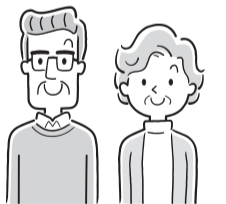
表 地域活動入門講座

▶ とき・内容(7日制) = 表参照 ▶ ところ = 大会議室B(区役所9階)など ▶ 講師 = 立教大学教授 藤井敦史ほか ▶ 対象 = 区内在住・在勤で、50歳以上の方 ▶ 定員 = 50人(抽選) ▶ 費用 = 1700円 ※ボランティア保険未加入者は350円が別途必要 ▶ 申込・問 = 9月30日(必着)まで、はがき・FAX・Eメールで、長寿社会推進課シニア活動支援係 ☎3579-2376 ☒3579-2309 ☒ki-senior@city.itabashi.tokyo.jp ※申込記入例(4面)参照