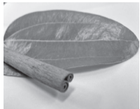
セイロンニッケイ