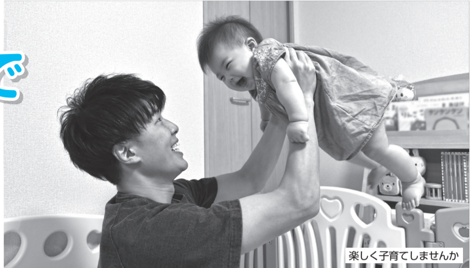
楽しく子育てしませんか

▶ とき = 10月10日(祝)10時～11時30分 ▶ ところ = 教育支援センター(区役所6階) ▶ 対象 = 区内在住のパートナー同士 ▶ 定員 = 8組※生後4か月～未就学児の保育あり(定員8人)