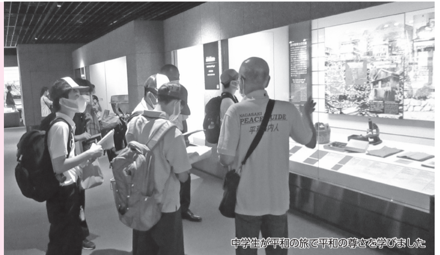
中学生が平和の旅で平和の尊さを学びました

太平洋戦争末期、子どもの命を守り抜こうと、日本で初めての保育園の集団疎開を描く作品を上映します。