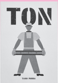
TON (Corraini Edizioni, 2004年)