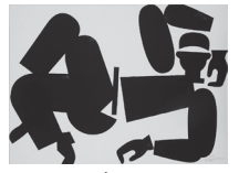
ワークマン名画 マティス 大きな横たわる裸婦 (2014年)