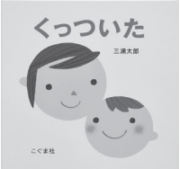
くっついた (こぐま社, 2005年)