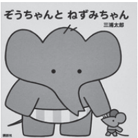
ぞうちゃんとねずみちゃん (講談社, 2016年)