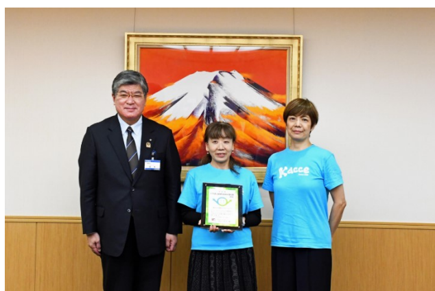
株式会社協同クリエイティブ 地域活性化を目指してタウン誌発行

板橋区では、ワーク・ライフ・バランスやダイバーシティ & インクルージョンの推進に積極的に取り組んでいる企業等を表彰する