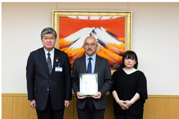
株式会社 NHC 柔軟な働き方で夢の実現を応援