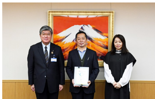
株式会社 RCdesign 多様な価値観を認め活かし合う環境