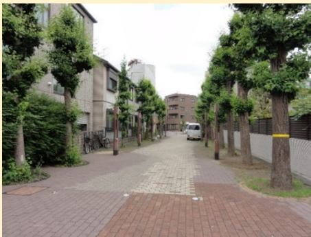
補助第26号線から水道タンクまでのイチョウ並木

今後、主要生活道路を整備するにあたり、 6mの幅員を確保するためには、現況のイチョウを全て残すことは困難な状況です。 そこで、イチョウの存続等について皆さまからのご意見を募集します。