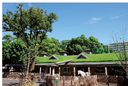
板橋こども動物園

若者の居場所としての i-youth において、さまざまな事業を通じた若者支援事業を実施します。事業実施にあたって、板橋区内外の大学、高校、NPO・ボランティア団体などの世代を超えた多様なネットワークを形成し、若者の活動を促進する仕組みをつくります。