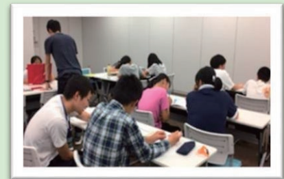
学び i プレイス