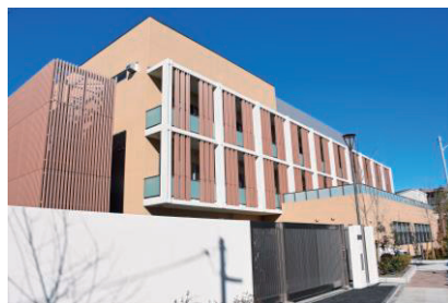
板橋区子ども家庭総合支援センター

不登校改善重点校を指定し、個々の不登校児童・生徒の状況に応じた必要な支援について、実効性のある取組を実践します。また、不登校対策特別委員会を開催し、学識経験者からの助言を基に取組を検討及び実践し、各学校に実践事例等を周知します。