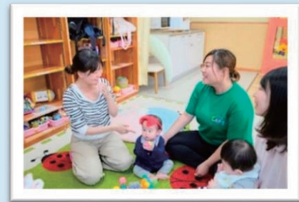
子育て応援児童館「CAP'S」