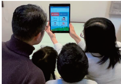
子育て支援情報アプリの利用イメージ

コロナ禍において、外出や対面での相談に不安を感じる妊婦や、体調不良などにより自宅安静や入院が必要で外出が困難な妊婦も妊婦面接を受ける機会を保障し、安心して出産・子育てに臨めるよう、来所による面接に加え、オンラインによる面接を導入します。