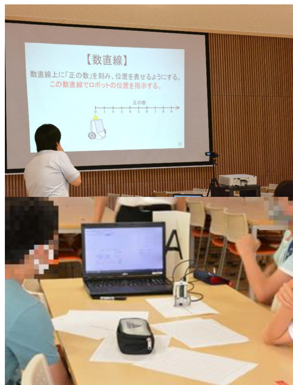
↑ ロボット実習の様子