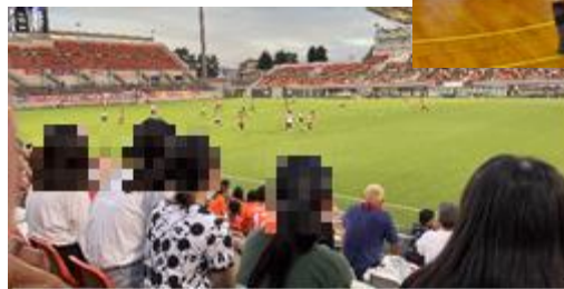
←WEリーグカップ観戦