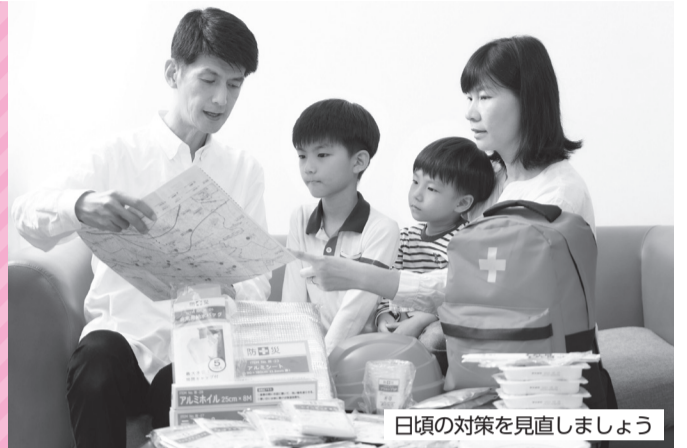
日頃の対策を見直しましょう

区の防災事業「いたばし防災プラスプロジェクト」では、日常生活に防災をプラスする様々な取組を行っています。この機会に、防災対策を強化しましょう。