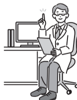
表2 医師によるもの忘れ相談

▶ とき・ところなど = 表2 参照 ▶ 対象 = 区内在住の65歳以上で、もの忘れで医療機関にかかっていない方※家族(区外在住を含む)も相談可 ▶ 定員 = 各回1人(申込順) ▶ 申込・問 = 電話で、希望会場を担当するおとしより相談センター