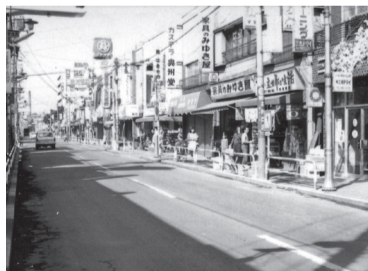
昭和47年の志村銀座商店街