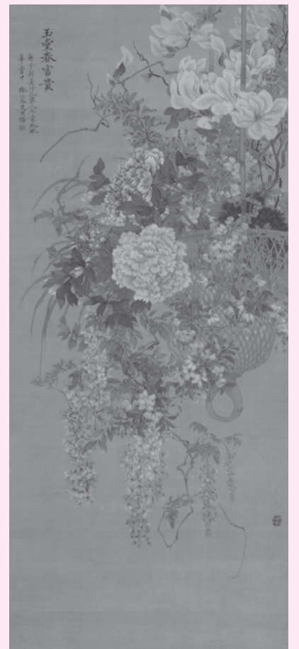
「玉堂富貴・遊蝶・藻魚図」のうち中幅 (泉屋博古館所蔵)・前期展示