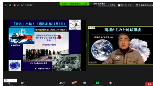
■板橋エコみらい塾（オンライン講演会）