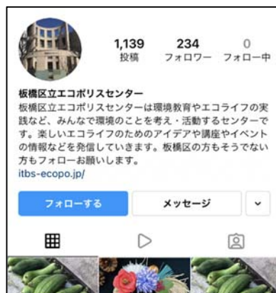
■エコポリスセンター インスタグラム