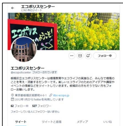
■エコポリスセンター ツイッター

※ エコポリスセンターの公式ホームページ、ツイッター、フェイスブック・インスタグラムの情報を更新した回数の合計を集計したものです。