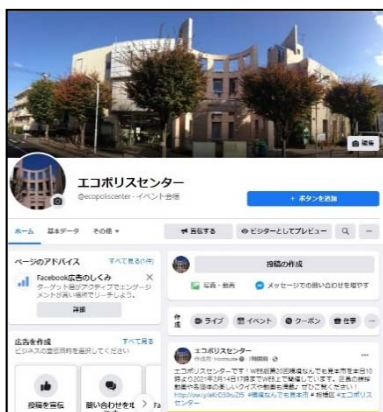
■エコポリスセンター フェイスブック