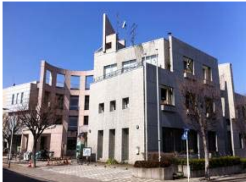
■ エコポリスセンター

今後も地域と密着した環境教育の拠点施設として、区民や事業者、団体などと連携を図り、良好なパートナーシップを築いていくための活動に取り組んでいきます。