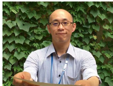
■ 令和4年度 動画によるWEB任命の様子