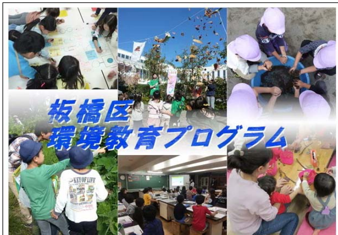
■環境教育プログラム（ホームページ画面）

https://www.city.itabashi.tokyo.jp/bousai/kankyo/kyoiku/1015347/index.html