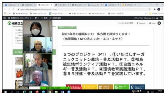
■環境なんでも見本市（オンライン交流会） 関連する活動指標

環境への「興味・関心」を深め、「参加・体験」していただく機会として、様々な環境関連のイベントを開催しています。環境保全活動の実践につなげるため、「環境なんでも見本市」などのイベントを実施し、意識啓発を行っています。