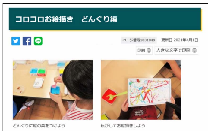
■プログラムの例：ココロお絵描き どんぐり編 (絵の具をつけたどんぐりを画用紙の上で転がしお絵描きをするプログラム：未就学児対象)