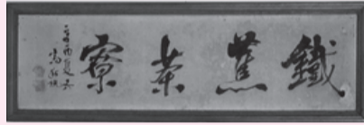
高島秋帆書「鐵蕉茶寮」