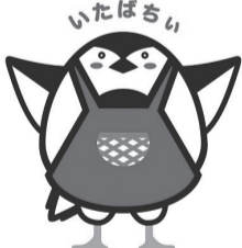
板橋区食育キャラクター