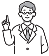
表1 医師によるもの忘れ相談

▶とき・ところなど=表1参照 ▶対象=区内在住の65歳以上で、もの忘れで医療機関にかかっていない方 ※家族(区外在住を含む)も相談可 ▶定員=各回1人(申込順) ▶申込・問=電話で、希望会場を担当するおとしより相談センター