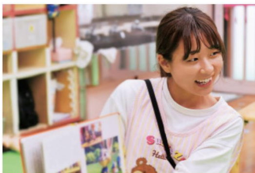
保育士 子ども家庭部保育サービス課(若木保育園)