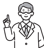
表3 医師によるもの忘れ相談

▶ とき・ところなど = 表3参照▶ 対象 = 区内在住の65歳以上で、もの忘れで医療機関にかかっていない方※家族(区外在住を含む)も相談可▶ 定員 = 各回1人(申込順)▶ 申込・問 = 電話で、希望会場を担当するおとしより相談センター