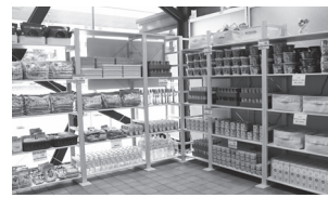
フードパントリー