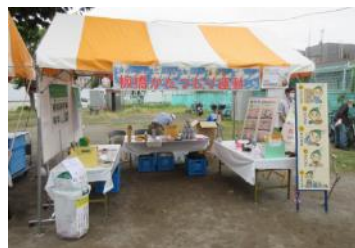
区民まつり等ブース出展