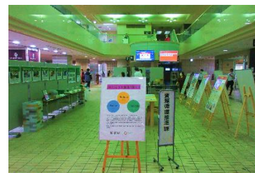
本庁舎1階イベントスクエア展示