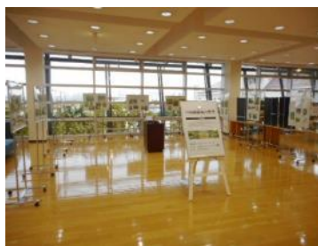
展示（リサイクルプラザ）

また、出前講座（環境学習）、リサイクルプラザやエコポリスセンターの講座イベント等との連携による、継続的な対面（展示含む）での周知・啓発機会の創出を検討する。