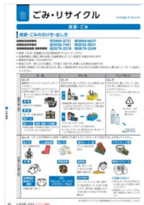
いたばしくらしガイド