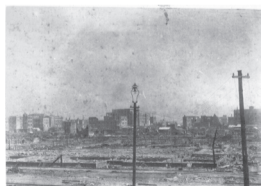
「東京駅前の焼け跡、日本橋方面」

首都直下地震は、今後30年以内に70%の確率で発生するといわれています。関東大震災から100年という節目の年に、もう1度防災について考え、災害に備えましょう。