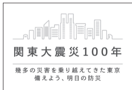
関東大震災復興100年ロゴ(東京都作成)