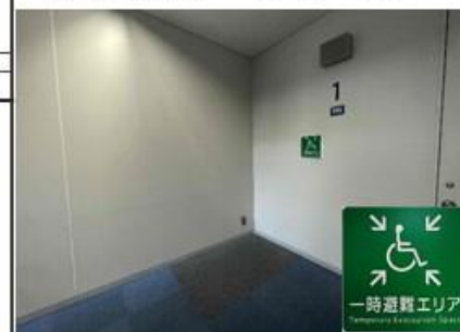
車いす利用者一時避難エリア

階段の各階の踊場に、緊急時、車いす利用者が一時待機できるスペース（150 cm×100 cm グレー部分）があります。