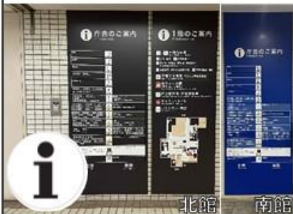
わかりやすい案内板

目的地へのスタート地点となるエレベーターホールには、字体・文字サイズ・色に配慮した、わかりやすい案内板があります。