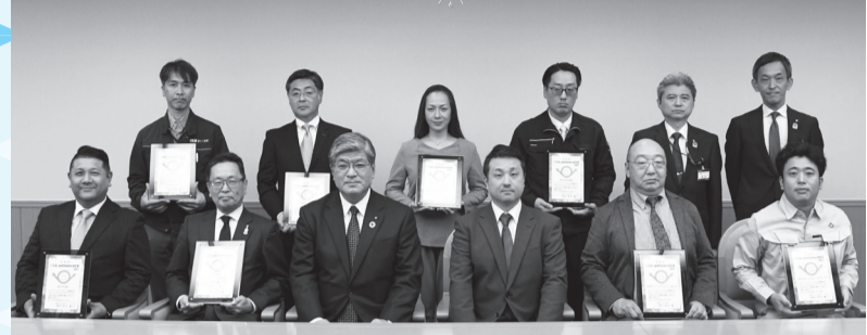
【受賞企業のみなさん】 株須賀(前列左端)、株大治(前列左から2人目)、東京都チャレンジドプラストッパン(株)(前列右から2人目)、株ノエマエンジニアリング(前列右端)、富士工業(株)(後列左端)、不退運輸(株)(後列左から2人目)、株プリントハウス(後列右から4人目)、株丸富商店(後列右から3人目)

「いたばしグッドバランス」とは 区では、だれもが生きやすく能力が発揮できる状態を「いたばしグッドバランス」と名付け、一人ひとりが多様な生き方を選択できる社会の実現をめざしています。互いにワーク・ライフ・バランスを認め合い、ともに成長できる地域社会づくりを推進しています。