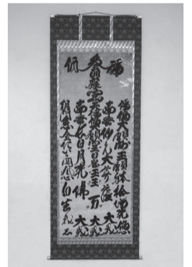
身禄系五行御師拔(永田講)