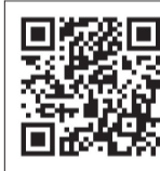
▲LINE登録はこちらから

混雑回避のため、入場整理券を配付します(なくなり次第受付終了)。申告書の作成・相談をされる方は、入場整理券が必要です。※国税庁公式LINEで事前発行または当日会場配付。詳しくは、お問い合わせください。