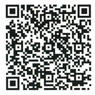
ボランティア通信

災害時支援ボランティアの活動を東京消防庁ホームページで紹介しています。詳しくは、右のQRコードから!