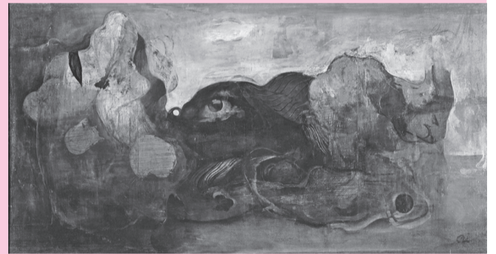
巖光「眼のある風景」(東京国立近代美術館所蔵)