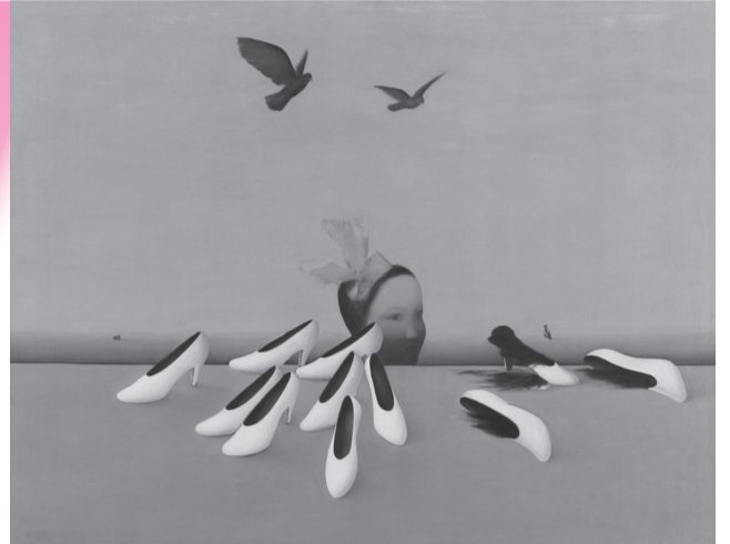
浅原清隆「多感な地上」(東京国立近代美術館所蔵)

1924年に、フランスで始まった芸術運動「シュルレアリスム」。「シュール」という言葉の語源であるシュルレアリスムの不可思議な作風は、当時の日本の画家たちを魅了しました。本展では、日本で展開したシュルレアリスム運動を振り返るとともに、日本の画家によるシュルレアリスムの代表作・資料を紹介します。