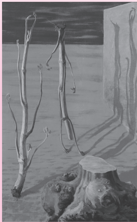
北脇昇「独活」(東京国立近代美術館所蔵)