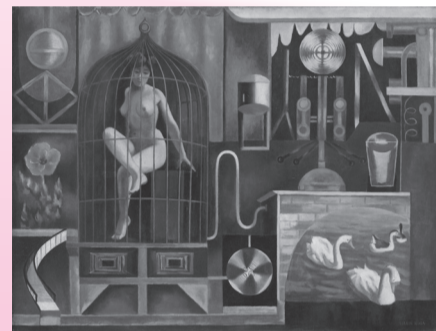
古賀春江「鳥籠」(石橋財団アーティゾン美術館所蔵)