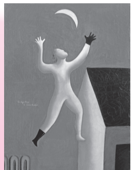
東郷青児「超現実派の散歩」(SOMPO美術館所蔵)