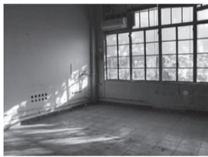
旧理化学研究所板橋分所

▶ とき = 4月20日(土)～6月23日(日)、9時30分～17時(入館は16時30分まで) ▶ 内容 = 日本の宇宙線研究を先導した理化学研究所板橋分所の紹介 ▶ 問 = 郷土資料館 ☎5998-0081(月曜休館。ただし4月29日(祝)・5月6日(休)は開館し4月30日(火)・5月7日(火)休館)