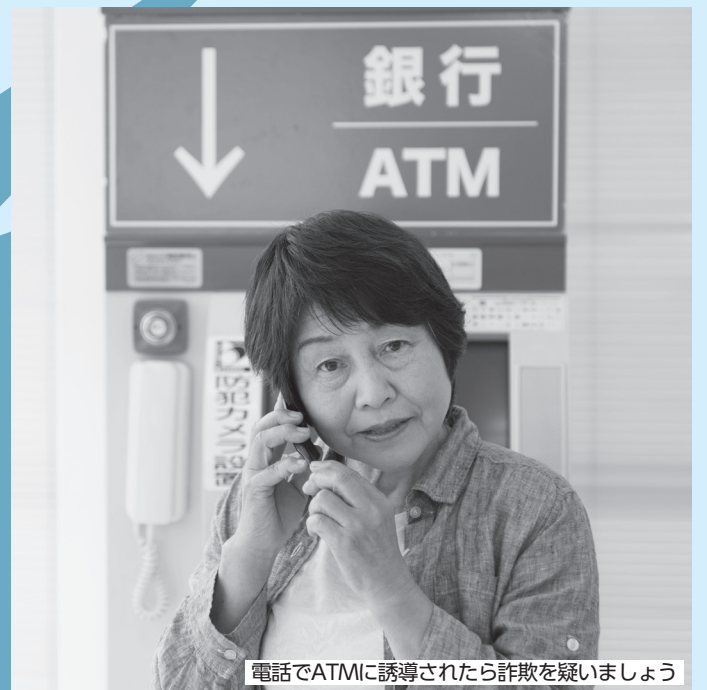
電話でATMに誘導されたら詐欺を疑いましょう

区内の特殊詐欺被害金額は3億4061万円(令和5年)となっており、被害が増加しています。犯人は、言葉巧みに金銭をだまし取ろうと狙っています。特殊詐欺から自分・家族を守るため、詐欺の手口を知り、被害を防ぎましょう。